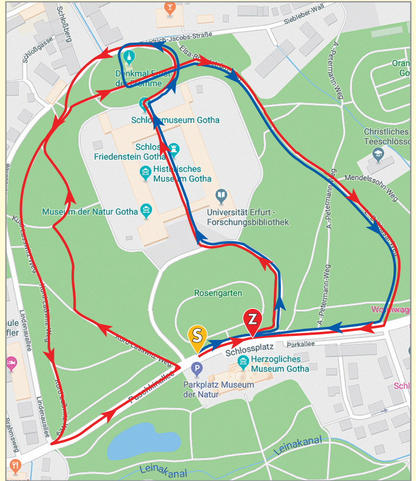
Schülerlauf 2,5 km