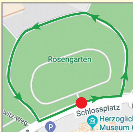
Schulstaffellauf 1 Runde = 400 m