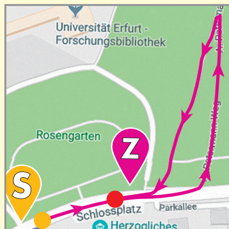
Bambinolauf 400 m